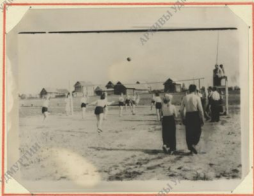
Команда девушек в момент игры.

В июле месяце в селе Вавоже проходили финальные соревнования, где наши волейболисты заняли третье место и были награждены комитетом физкультуры Республики дипломами третьей степени.