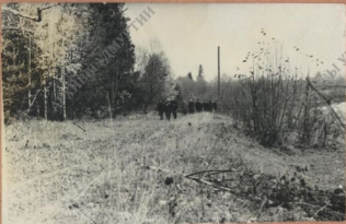
По родным просторам.

комсомолками рассказана о своей жизни и работе. А повесть её очень интересная и поучительная.