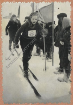
Борьба до финише.