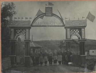
Наша туристическая группа в Варзи-Стуке. июль 1963 год.