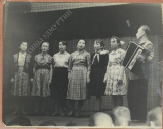
Участки художественной самодеятельности.