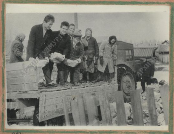
Комсомольцы помогают в выгрузке камня.