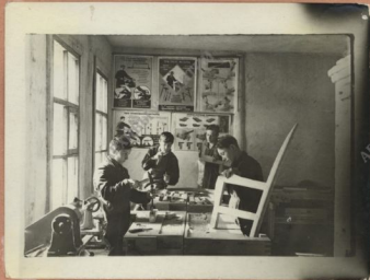
Работа в мастерской.