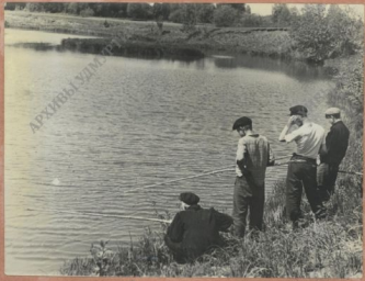
Группа рыболовов у реки Мезь.