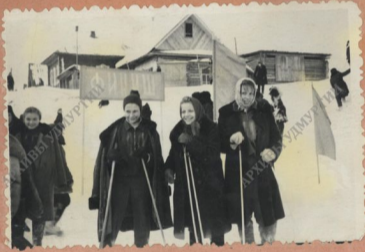
команда, занявшая 106 место на спортивном празднике школы. 9 класс.