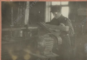
Труд в школьной мастерской.