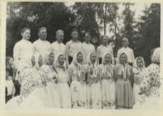
КОЛЛЕКТИВ художественной самодеятельности колхоза " Година ".