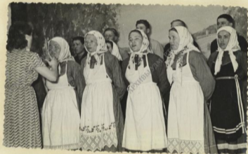
КОЛЛЕКТИВ художественной самодеятельности колхоза "Красная Звезда"