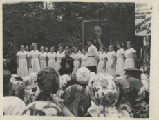
КОЛЛЕКТИВ художественной самодеятельности совхоза имени "10 лет УАССР".