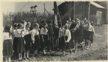
Показательный орядный сбор 6-го класса М-Пургинской средней школы.