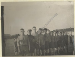
Оборная команда райцентра после очередного матча по футболу.