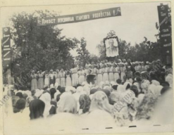
Выступление коллектива художественной самодеятельности колхоза "Иж-Пурга" на праздновании дня животноводов.