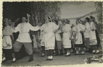
Танцевальный коллектив колхоза " Молния "