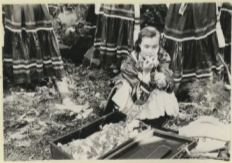
Перед выходом на сцену нужно привести себя в порядок. Выступление на полевом стане.