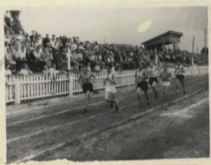
Спортсмены И-Пургинской средней школы на беговой дорожке в день открытия спортивного сезона.