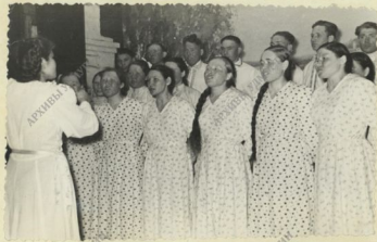
КОЛЛЕКТИВ художественной самодеятельности колхоза имени Кирова.