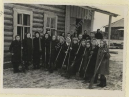
Учащиеся 5-го класса М-Пургинской средней школы после озеленения райцентра.