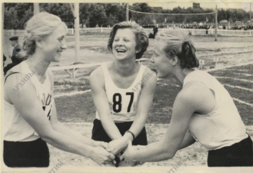
Поздравление после успешного окончания районных соревнований.