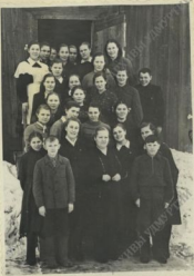
Учащиеся М-Пургинской средней школы после окончания учебного года.