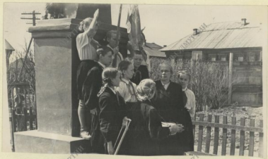
Бези у памятникка конисору Бунки.