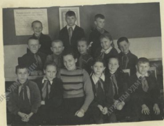
Проведено I-е занятие с отрядными вожаками при Доме пионеров.