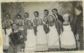
КОЛЛЕКТИВ художественной самодеятельности колхоза "Восток-Сергей".