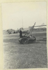
Открытие летнего спортивного сезона в село И-Пурга.