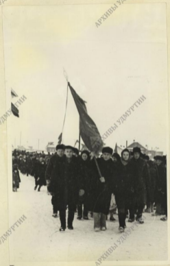
Ее участие в памятной борцам революции.