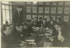
Занятие школы комсомольского актива при Райкоме ВЛКСМ.