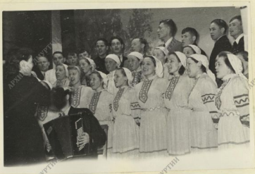
КОЛЛЕКТИВ художественной самодеятельности колхоза "Иж-Пурга" удостоенный диплома I-й Степени.