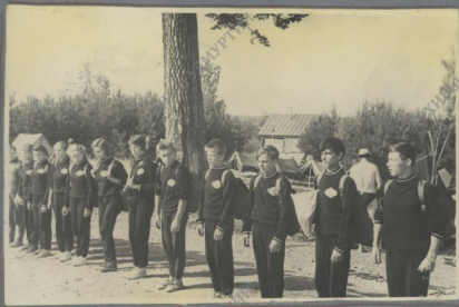
Команда наших туристов на республиканском слёте.