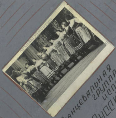
Танцевальная группа исполняет "Дудочки и танец"