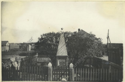
НИКТО НЕ ЗАБЫТ, НИЧТО НЕ ЗАБЫТО.