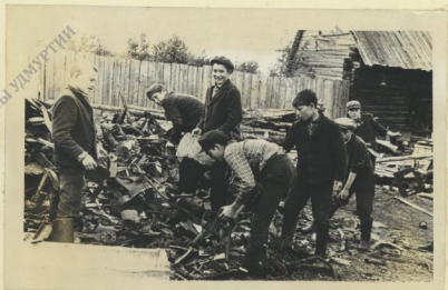
В ФОНД ПОМОЩИ БОРОЩЕМУСЯ ВЬЕТНАМУ.