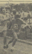
На снимках: (слева) будущая чемпионка. (Справа) на одном из этапов ледостателетической эстафеты на приз газеты «Красное Прикамье».