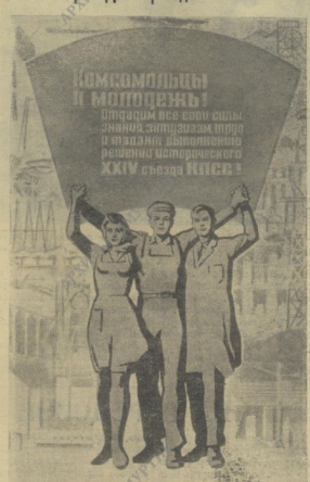
Плакат художника Е. Соловьева, выпущенный издательством «Изобразительное искусство».