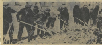
Работницы отдела 56 на субботнике.