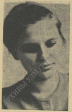
НА СНИМКЕ: Л. Птиримова.