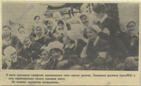
В июле проходили городские соревнования среди тарных дружин, Заводская дружина (цеха № 6) в этих соревнованиях заняла призовое место. На снимке: коллектив сапруджун.

секретарь комсомольской организации цеха № 8.