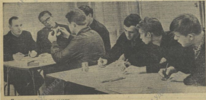
Идут слесари завода по теории.