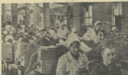
Эта молодежь трудилась в день субботника на сборе автомобильного приемника в цехе № 8.

Вьетны. К тому сейчас обращены взоры всего прогрессивного человечества мира. Мужественный и трудолюбивый народ этой первой в юго-восточной Азии страны, вставший на путь строительства социализма, ведет упорную борьбу за свою независимость с вооруженными до зубов американскими войсками. И в этой справедливой освободительной войне вьетнамский народ не одинок, на его стороне все прогрессивное человечество. Большую помощь героическому народу ока-