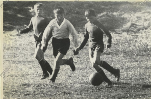
Один из моментов игры.

13 За третье четвертое место встретились команды " Волна " и " Орлёнок ". Победителем выходит команда " Орлёнок " со счётом 2 : 1