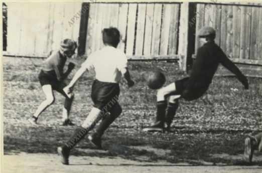
Опасный момент игры создан у врат команды "Аэлита"

11 Напряжённой была игра между командами "Югдон" и "Аэлита" в борьбе за первое место. И упорным трудом досталась победа команде "Югдон", они выигрывают со счётом 2 : 0