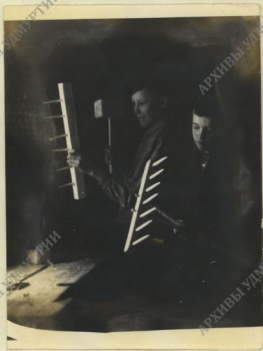
Идёт подготовка к сенокосу.