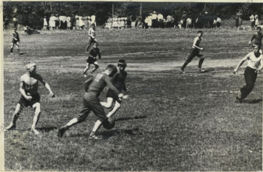
Такой была игра между командами "Югдон" и "Ракета"