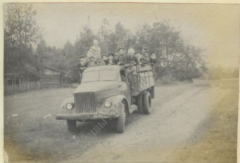
Выезд на сенокос.