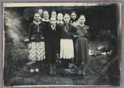
Активные участники Тудомсербской самодеятельности школы.