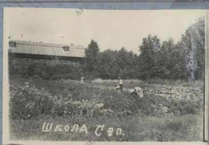
Биолог школы Никитина А.П. с сезонными учащимися на прополке на пришкольном участке.