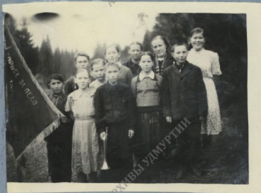
Лучшие спортсмены школы.