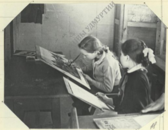
Идут занятия в изобразительной.