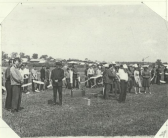
Тока еще видно.