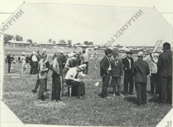
Оживленный обмен мнениями.