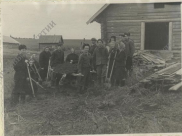
Учащиеся ремонтируют свинарник в колхозе "Путь Ленина"