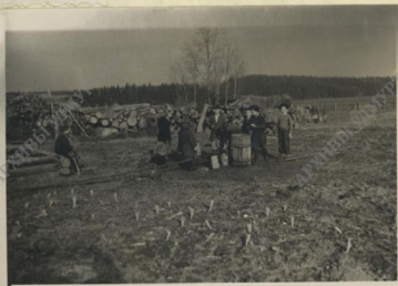
Перед поливкой деревьев в школьном саду.