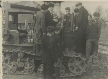
Урок машинovedения в 9-классе.

В октябре этого года собрали 17 т. металлолома. На верхнем снимке угады- весь сдавшие больше 200 кг. лома на каждого человека, у собранного лома.