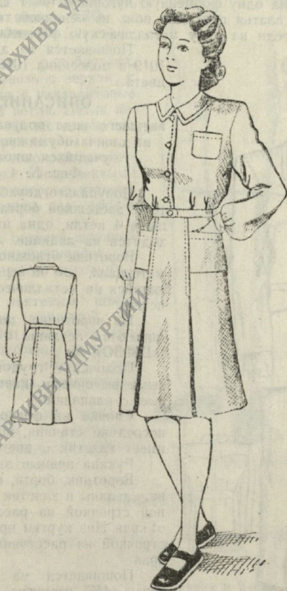
Фиг. № 3