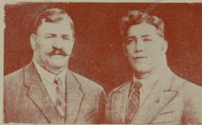
И. М. Поддубный и Н. Г. Жеребцов 1940 г.