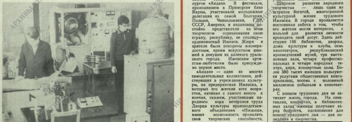
В одной из лабораторий Ижевского механического института.

ЗАМЕЧАТЕЛЬНЫЕ УСПЕХИ НАШЕЙ РЕСПУБЛИКИ В ХОЗЯЙСТВЕННОМ И КУЛЬТУРНОМ СТРОИТЕЛЬСТВЕ — РЕЗУЛЬТАТ ОСУЩЕСТВЛЕНИЯ ЛЕНИНСКОГО НАЦИОНАЛЬНОЙ ПОЛИТИКИ КОМУНИСТИЧЕСКОЙ ПАРТИИ. В БРАТСКОМ СЕМЬЕ СОВЕТСКИХ НАРОДОВ УДМУРТСКИЙ НАРОД ДОСТИГ ПОДЛИННОГО РАСЦВЕТА. И А С И М К Б Е М О Н У М Е Н Т Д Р У Ж Б Ы Н А Р О Д О В В С Т О Л П Е У Д М У Р Т И — И Ж Е В С К Е.