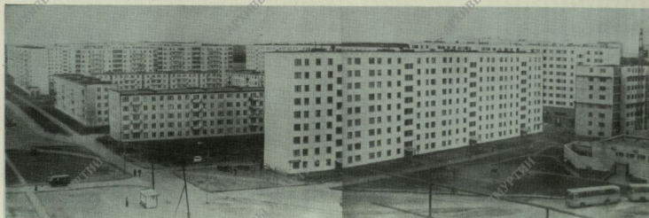
Один из новых жилых микрорайонов

Рабочие промышленных предприятий активно участвовали в создании фонда Победы, в патристическом движении при оказании всемерной помощи фронту.