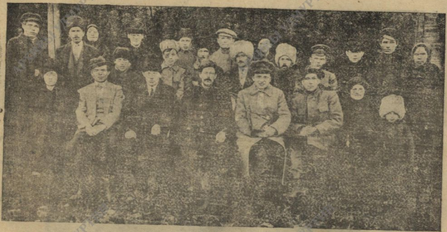
Сотрудники Центрального Комиссариата по делам вояков.